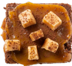
BROWNIE FUDGE ZEEZOUT Butterscotch karamel - vanillefudge 4.00